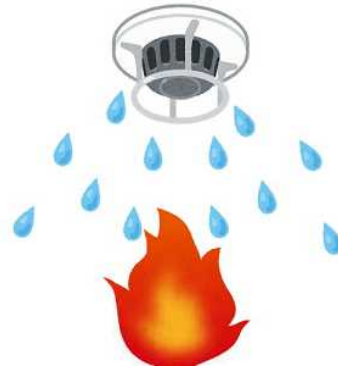
スプリンクラー設備